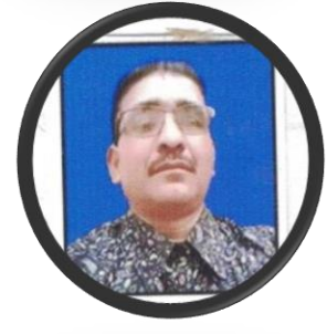
मा.रातो कामी सदस्य