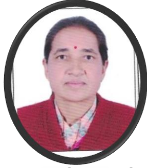
मा.देवी ओली अध्यक्ष